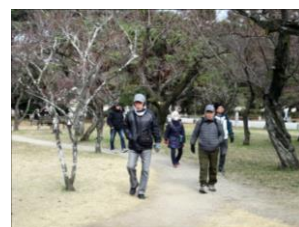
京都御苑ウォーキング