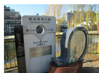
駅伝発祥の石碑 (三条駅前)