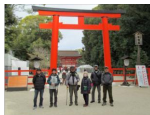
下鴨神社南口鳥居前