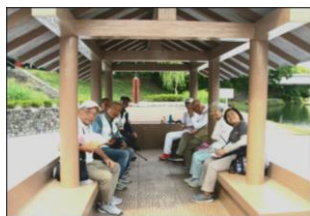
屋形船の中で昼食