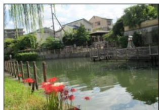
対岸の龍馬とお龍の像